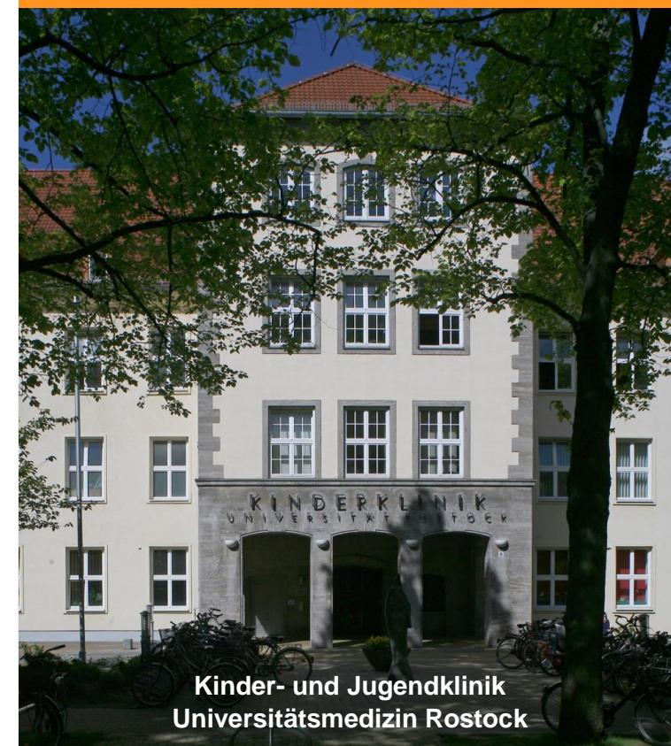
Kinder- und Jugendklinik Universitätsmedizin Rostock

K Patientenaufnahme/Kasse + Notaufnahme I Orientierungshilfe C Cafeteria H Krankenhausseelsorge P Parkscheinautomat