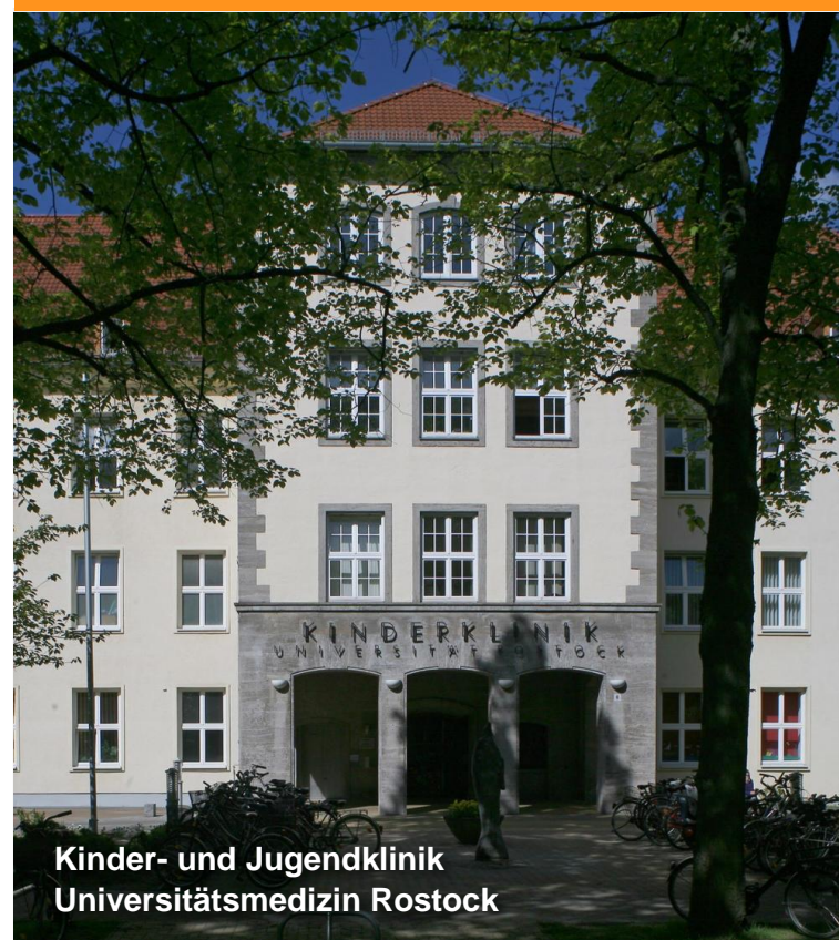
Kinder- und Jugendklinik Universitätsmedizin Rostock

Legende: K Patientenaufnahme/Kasse + Notaufnahme i Orientierungshilfe ☺ Cafeteria ☼ Krankenhausseelsorge P Parkscheinautomat